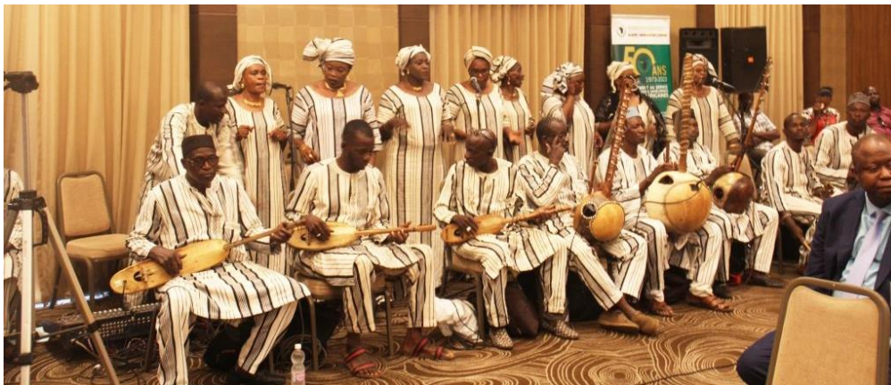
Intermède folklorique avec la troupe culturelle de Bamako