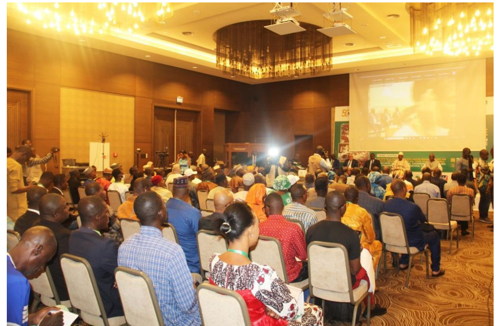
Vue des participants

L'objectif global de cette 1 ère Conférence organisée par le CILS à travers l'Institut du Sahel est d'identifier des orientations de politique, de stratégie et d'actions pour renforcer la résilience des marchés ouest africaine et sahéliens et contribuer ainsi aux réponses politiques définies face aux défis en Afrique de l'Ouest et au Sahel, dont notamment le niveau élevé de l'insécurité alimentaire, le défi climatique, l'extrême violence et la dégradation de la cohésion sociale, les impacts de la Covid19 et de la guerre russo-ukrainienne.