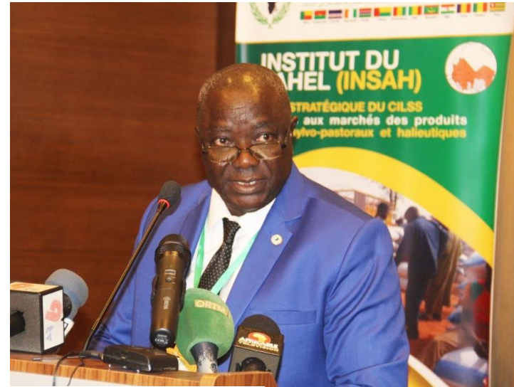
Allocution du SEA CILSS