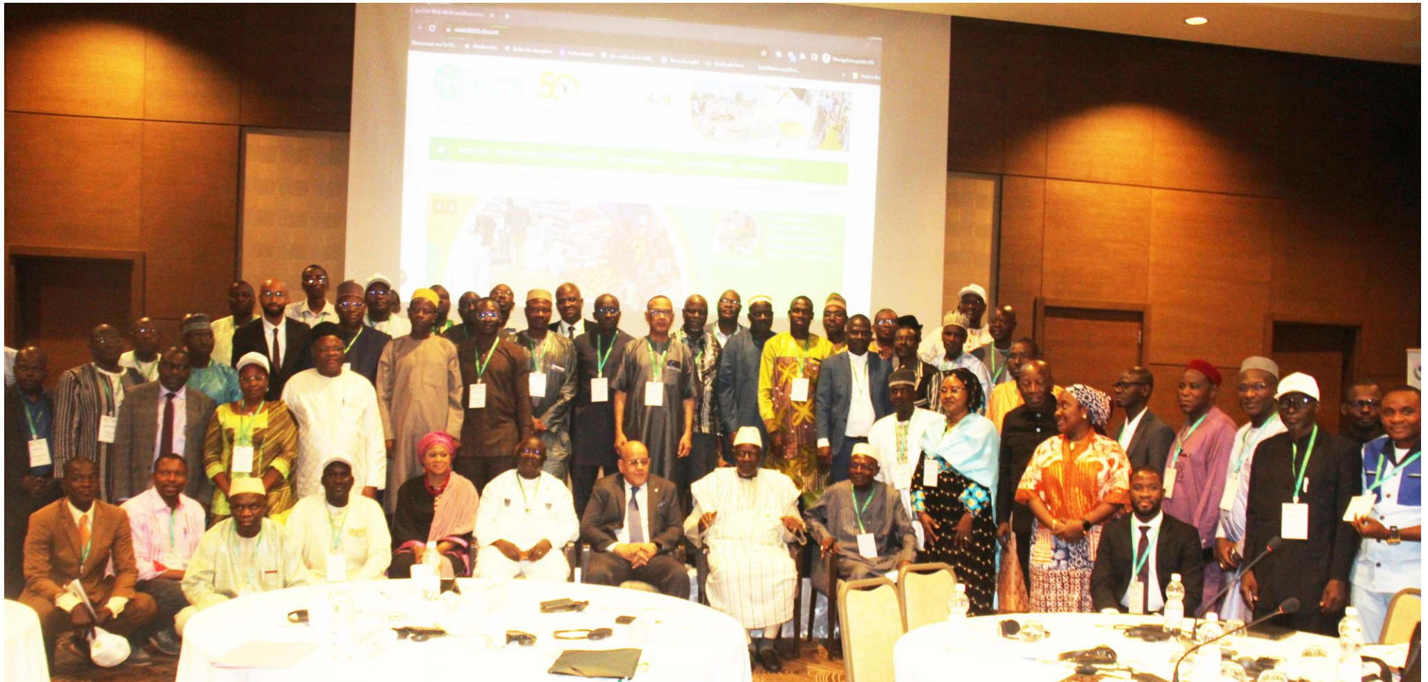
Photo de famille