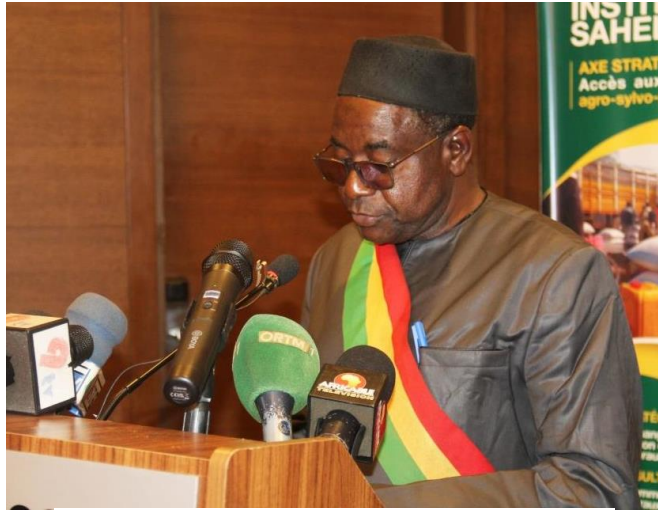
Mot de bienvenue du Maire de district 4

...cinq interventions ont marqué cette cérémonie d'ouverture