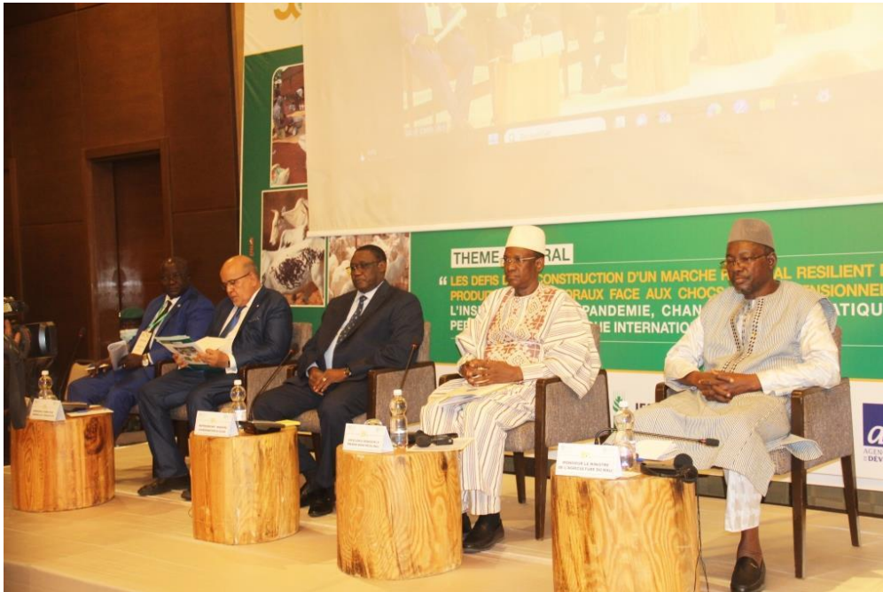
Présidium de la cérémonie