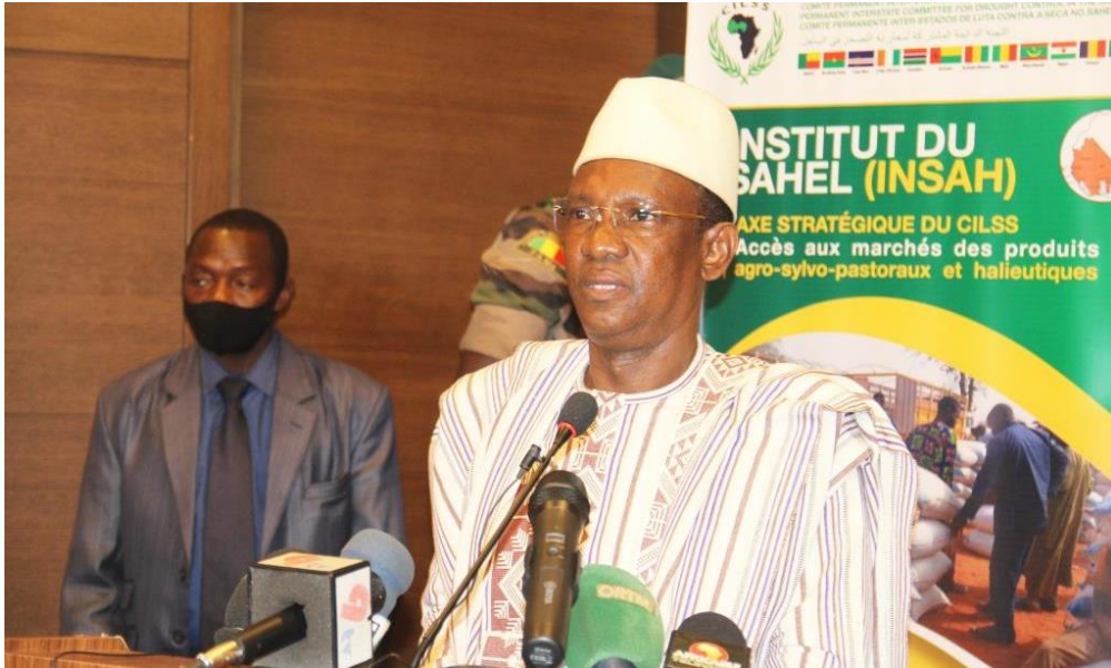
Discours d'ouverture de SEM Choguel Kokalla Maiga