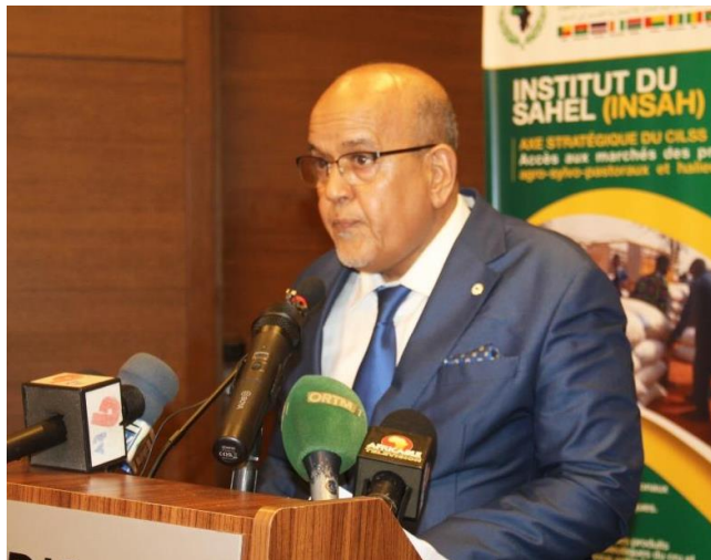
Mot du DG INSAH