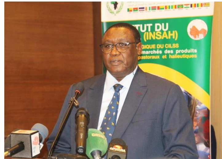
Allocution du Secrétaire d'Etat du Tchad