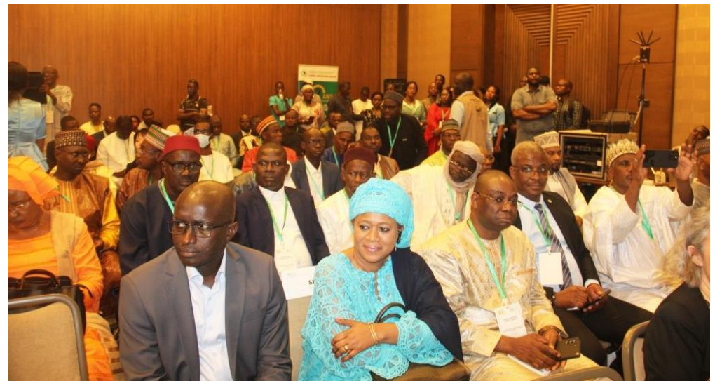
Vue des participants